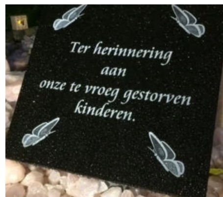
monumentje gestorven kinderen

Op de laatste zondag van het kerkelijk jaar, de gedachteniszondag, geven we de laatste 2 jaar iedereen de gelegenheid mensen te gedenken die niet via onze kerk zijn uitgedragen, maar voor wie dan toch even de aandacht wordt gevraagd. In de dienst in 2025 werd door iemand het gemis genoemd van 4 van haar kinderen en 4 kleinkinderen. Een gemis waar niet voor is gekozen maar wel dagelijks voelbaar. Dit heeft tot reacties geleid, waarbij het opvallend was dat in die reacties werd genoemd het gemis aan pastorale begeleiding voorheen bij het sterven van een kind, bij een miskraam, bij een abortus, maar ook de manier waarop het in de kerk (en in de maatschappij) werd doodgezwegen. Niet iedereen die zoiets heeft meegemaakt in zijn/haar gezin voelt ervoor om dat weer naar boven te halen. Anderen zouden het juist wel graag een plekje of aandacht geven. Binnen de kerkenraad is hierover gesproken en aan de liturgiecommissie is gevraagd dit verder uit te werken. Het komt erop neer dat aan de zijkant van de kerk (bij de kaarsenbak voor de kosterbank) een monumentje wordt ontworpen, met