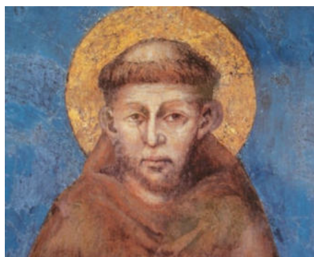
Franciscus van Assisi

Het jubeljaar wordt door de paus echter aangeboden aan alle christelijke gelovigen zonder onderscheid als aanmoediging om het voorbeeld van Franciscus na te volgen en getuigen van vrede te worden. Onder de voorwaarden die gelden bij een dergelijk jaar, wordt de gelovigen de mogelijkheid van een volledige aflaat aangeboden.