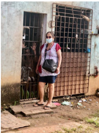
Vastenactie 2026 Bolivia