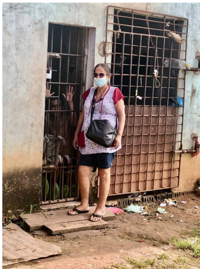
Vastenactie 2026 Bolivia

Namens de Missie Ontwikkeling en Vredesgroep bij voorbaat hartelijk dank voor uw bijdrage aan dit project.