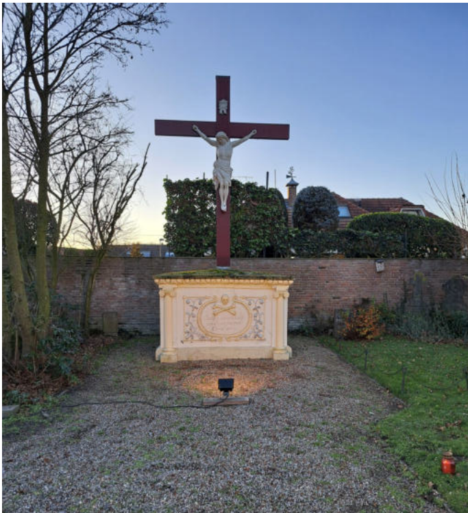
Lichtjes op het kerkhof tijdens Kerstmis

Deze positieve reacties doen ons goed. Mede daarom zetten wij deze waardevolle traditie in de toekomst graag voort.