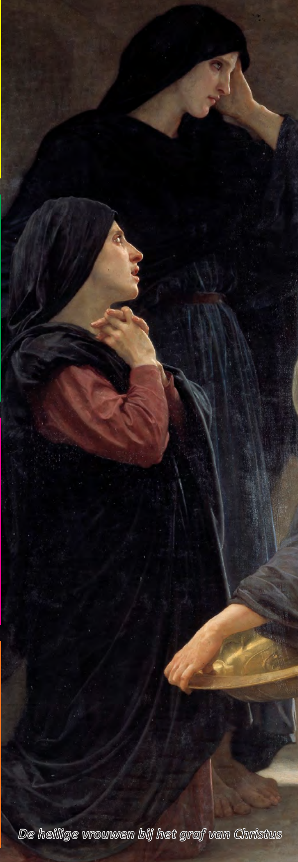
De heilige vrouwen bij het graf van Christus