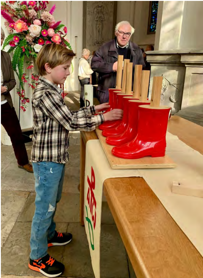
Muziek in de kerk