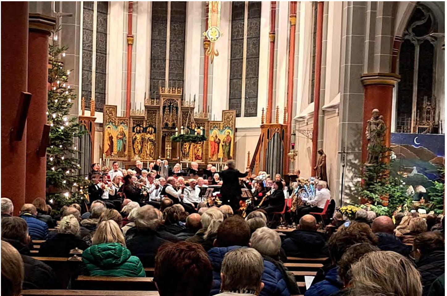
Kerstconcert 13 december 2024