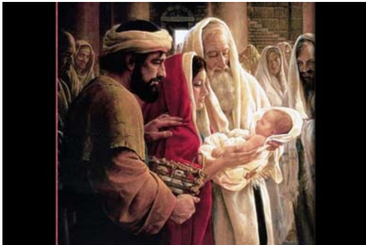
Toewijding van Jezus in de tempel Simeon en Hanna loven God